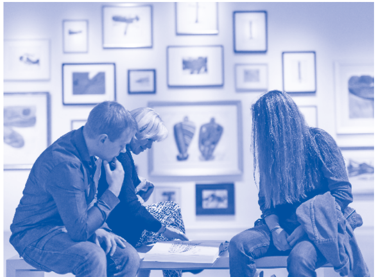
museum gugging

Bei der Planung von Kooperationen sollte gleichermaßen auf die strategisch-langfristige Perspektive geachtet werden wie auch auf die Möglichkeit, zeitaktuell auf relevante Entwicklungen reagieren zu können.