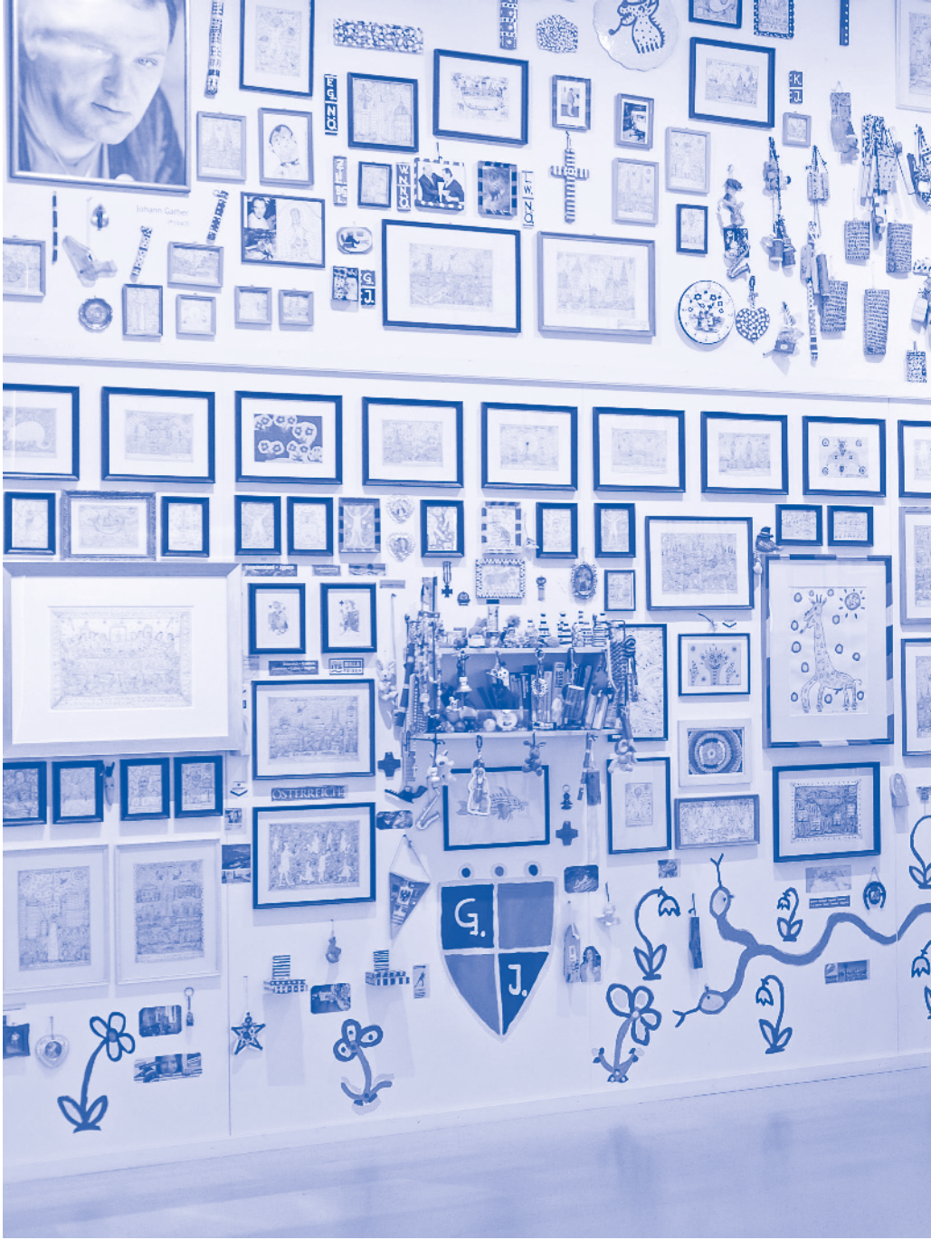
museum gugging - Garber Salon