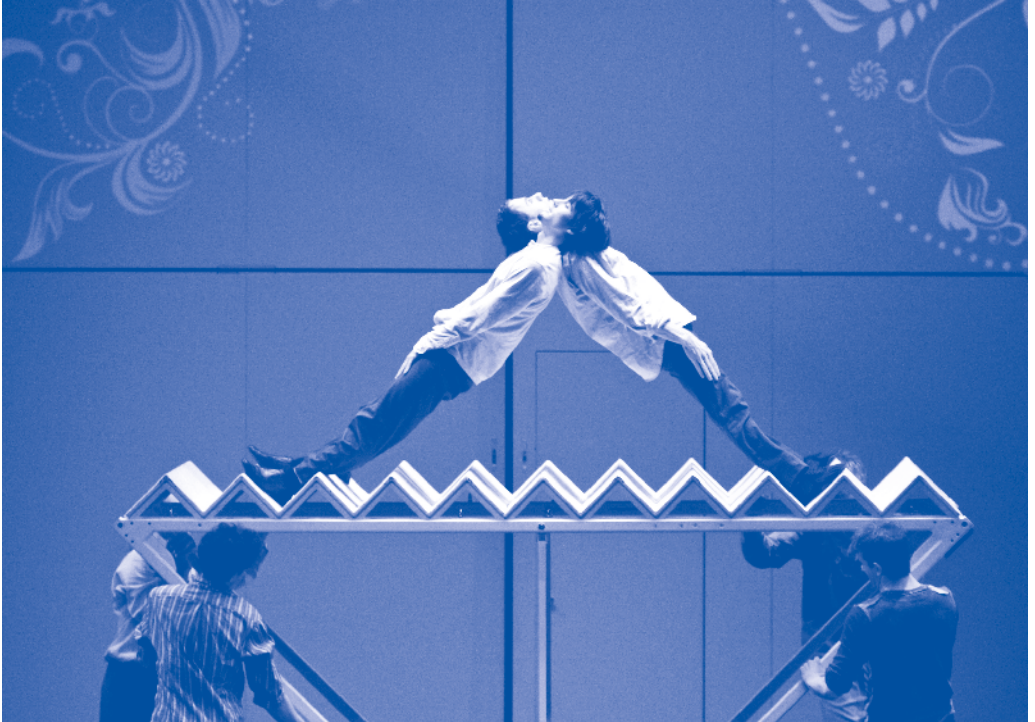
Psy stairs © Peggy Faye

Dadurch entsteht die Möglichkeit, innerhalb der NÖKU-Gruppe Gemeinschaft zu denken, zu lernen, zu entwickeln und schließlich zu leben.