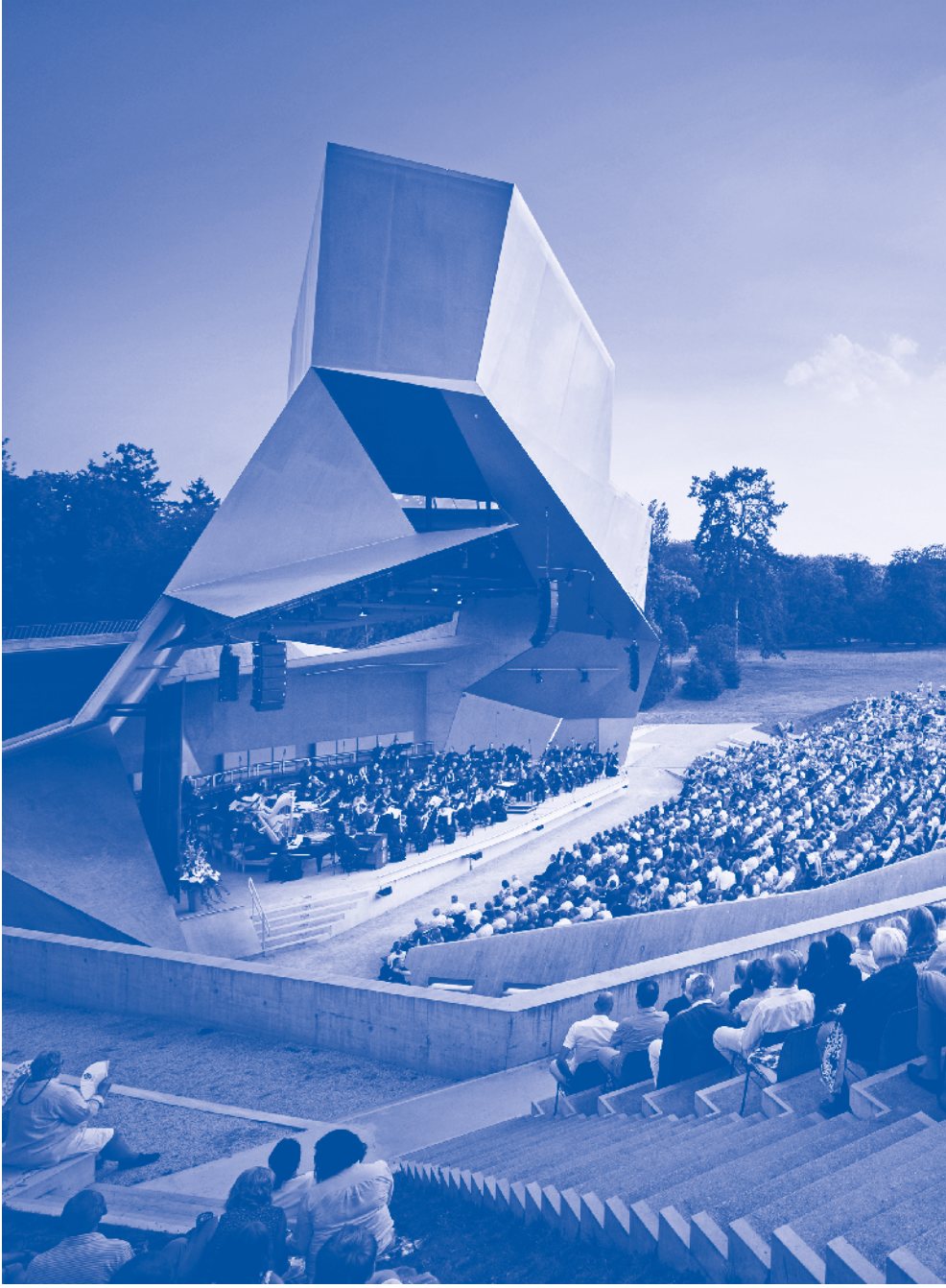
Grafenegg Wolkenurm