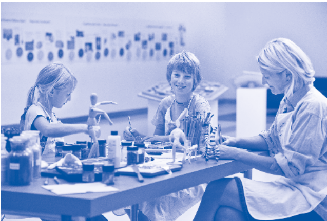
NÖ Landesmuseum - Das Museum für die ganze Familie